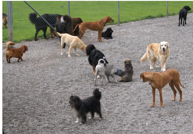
Was tun Hunde unter sich?